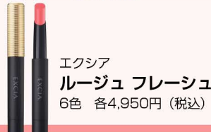
エクシア ルージュフレーシュ 6色 各4,950円(税込)