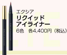
エクシア リキッド アイライナー 6色 各4,400円(税込)