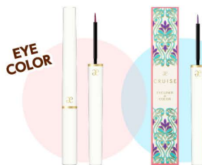
エレガンス クルーズ アイライナー&カラー 〈アイライナー・アイカラー〉 新5色・限定2色 各2,530円(税込)