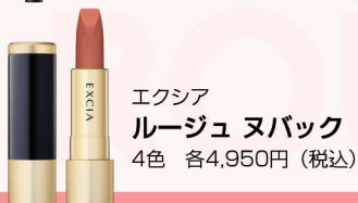
エクシア ルージュヌバック 4色 各4,950円(税込)