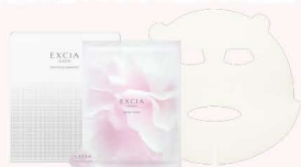
エクシア ブルーミング ウイークエンド 4回分 11,000円(税込)

【セット内容】 ・ソフニングゴマージュ 〈マッサージ〉 5.0g×4個 ・ジュレマスク 〈パック〉 40ml×4枚