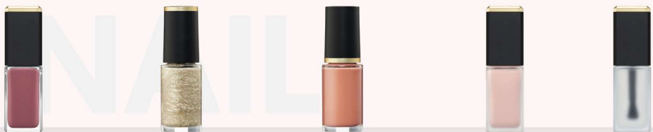
エクシア ヴェルニ 〈ネイルカラー〉 7色 各2,750円(税込) エクシア ヴェルニ ライン 〈ネイルカラー〉 3色 各1,870円(税込) エクシア ヴェルニ ポイント 〈ネイルカラー〉 5色 各1,870円(税込) エクシア ベースコート 2,750円(税込) エクシア トップコート 2,750円(税込)