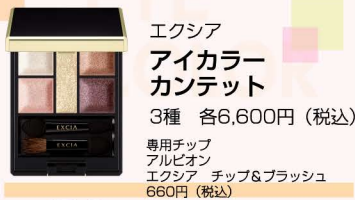
エクシア アイカラー カンテット 3種 各6,600円(税込) 専用チップ アルビオン エクシア チップ&ブラッシュ 660円(税込)