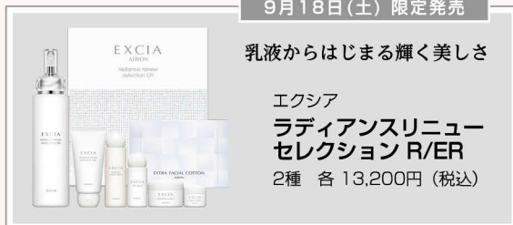
エクシア ラディアンスリニュー セレクション R/ER 2種 各13,200円(税込)