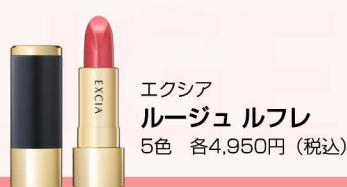
エクシア ルージュルフレ 5色 各4,950円(税込)