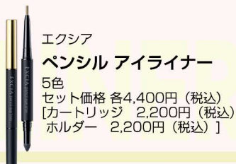
エクシア ペンシル アイライナー 5色 セット価格 各4,400円(税込) [カートリッジ 2,200円(税込) ホルダー 2,200円(税込)]