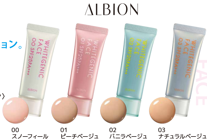
00 スノーフィール 01 ピーチベージュ 02 バニラベージュ 03 ナチュラルベージュ

アルビオン ホワイトジェニック フェイス (美白美容液・メイクアップベース・ファンデーション) 40g 4色 各 4,950円(税込) SPF25 PA+++ [医薬部外品] 美白有効成分：トラネキサム酸